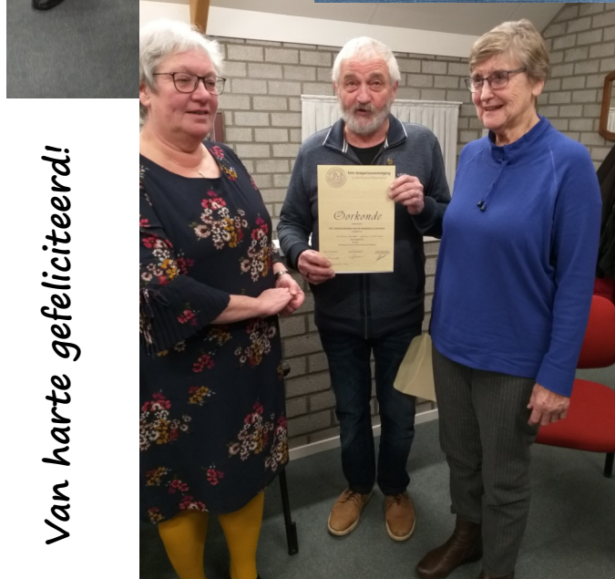
Van harte gefeliciteerd!